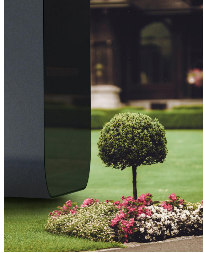
*temsili görsel, kabin : studypod