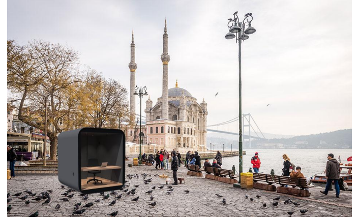
*temsili görsel, kabin : studypod